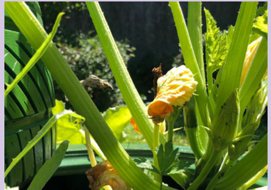
Lohn der Arbeit: Prächtige Zucchini-Pflanzen.