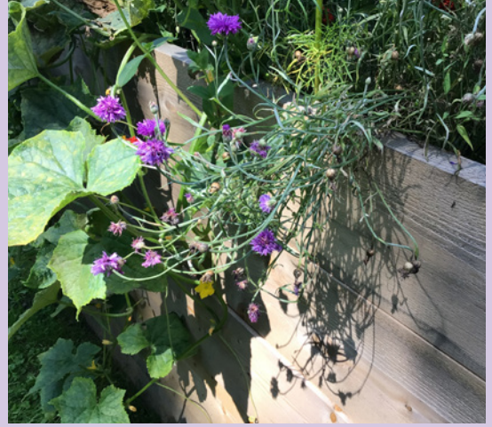
Wirklich wahr – Schnittlauch kann lila blühen.

Doch wer ein Projekt beginnt, muss es in der Regel auch beenden. Dazu gehört nicht nur der erfolgreiche Aufbau des Hochbeetes, sondern auch das Aufräumen aller gebrauchten Materialien. Auch eine Erfahrung, welche die Klasse in dieser Woche mit den Lehrpersonen teilte.