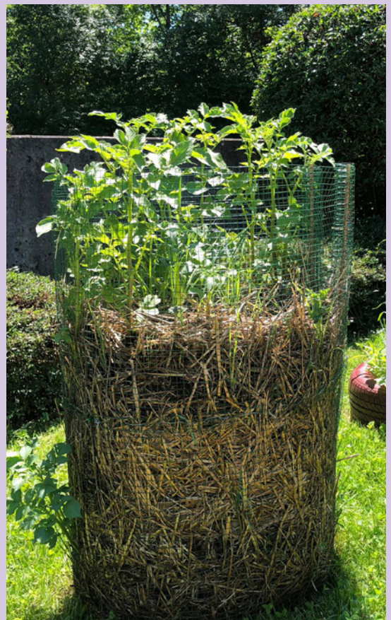
Vor der Ernte muss das Beet eingerichtet werden.